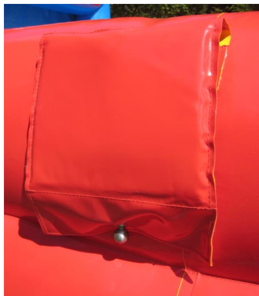
Stangenabdeckungen nur unten befestigen.

Der Abbau erfolgt in umgekehrter Reihenfolge.