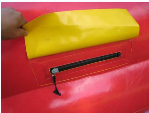
Beide Lüftungsschlitze schließen! Jeweils vom Tor außen gesehen links!

Den Anschluss Schlauch mit Hilfe des Spanngurtes am Gebläse befestigen. Bitte prüfen Sie, ob die Entlüftungsschlitze geschlossen sind. Das Gebläse einschalten und warten, bis sich der Rahmen prall gefüllt hat.