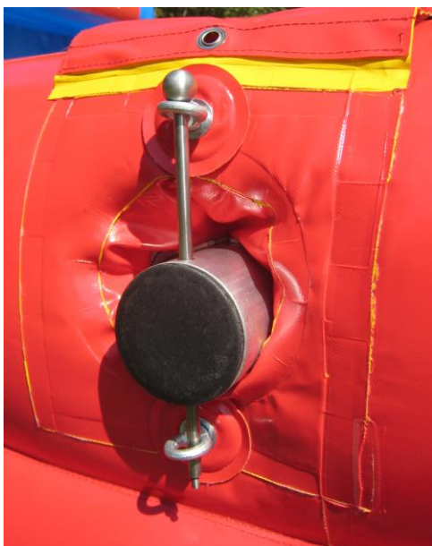
Die Arretierstangen von oben durch die Ringmuttern und Alustangen schieben.

Anschließend werden die Alurohre mit den Arretierstangen an der Außenwand befestigen. Die Arretierstangen durch die Ringmuttern am aufgeblasenen Lebendkicker und durch die Bohrlöcher an den Alustangenenden schieben. Die Stangenabdeckung nur unten über das untere Gewinde der Arretierstange ziehen und mit der Metallkugel verschrauben.