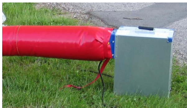
Anschluss über das Gebläse schieben und mit dem Spanngurt sichern.

Achtung: Ist der Rahmen des Lebendkickers verdreht, muss die Luft unbedingt wieder abgelassen werden, um das Spielgerät neu auszurichten.