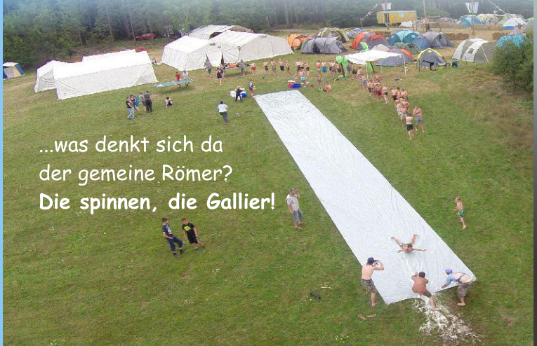
...was denkt sich da der gemeine Römer? Die spinnen, die Gallier!

Bei Schäden durch höhere Gewalt oder Einzelunternehmungen ohne Einverständnis der Freizeitleitung übernehmen wir keine Haftung.