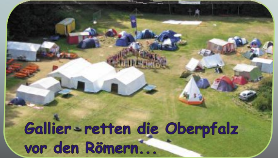
Gallier - retten die Oberpfalz vor den Römern...

CVJM Arbeitsgemeinschaft Bayreuth Wittelsbacherring 26 · 95444 Bayreuth Tel.: 0921/34 77 80 41 Email: info@cvjm-bayreuth.de Fax: 0921/16 81 90 53 www.cvjm-bayreuth.de