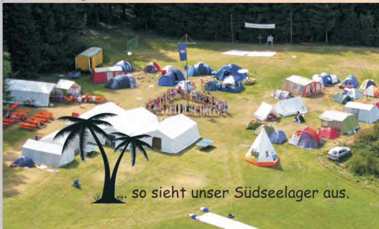
so sieht unser Südseelager aus.

Bei Schäden durch höhere Gewalt oder Einzelunternehmungen ohne Einverständnis der Freizeitleitung übernehmen wir keine Haftung.